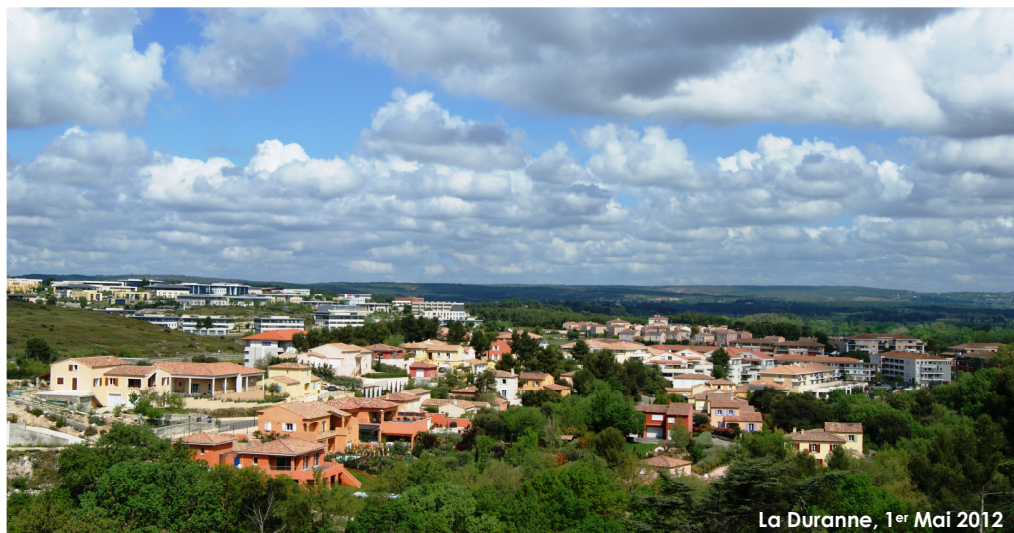
La Duranne, 1 er Mai 2012