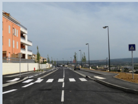
Rue Copernic – après travaux